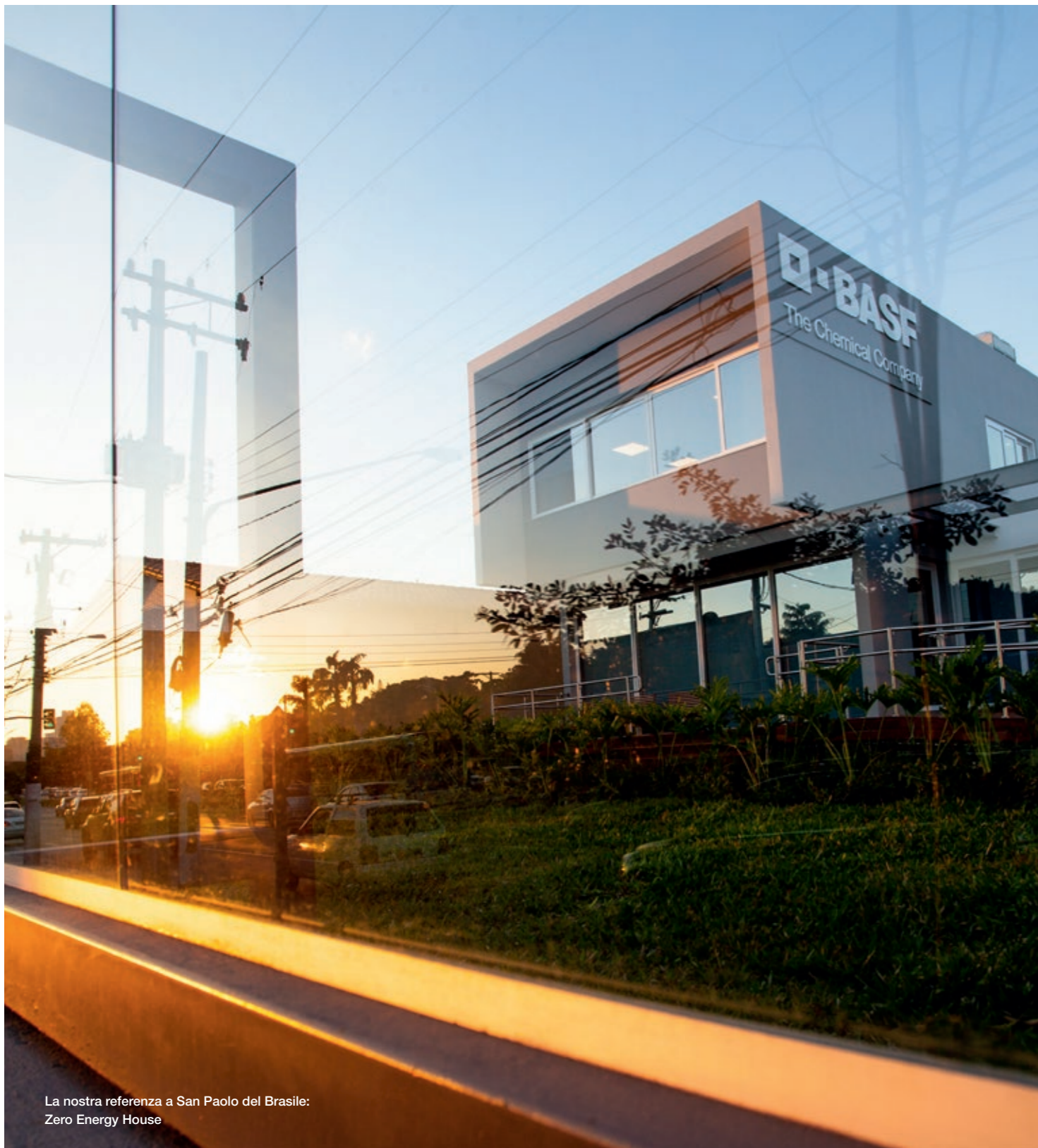
La nostra referenza a San Paolo del Brasile: Zero Energy House