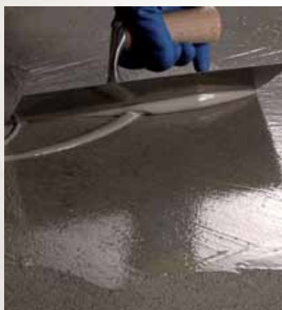
Primer SN + Quarzo 1,2