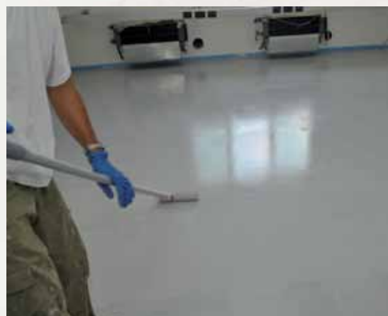
Mapefloor Finish 52 W + Mapelux Opaca